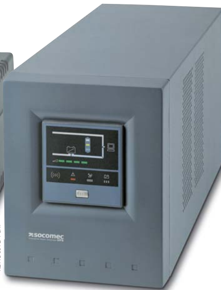
NETYS PE 1 000 VA